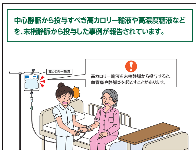
No.209 中心静脈から投与すべき輸液の末梢静脈からの投与